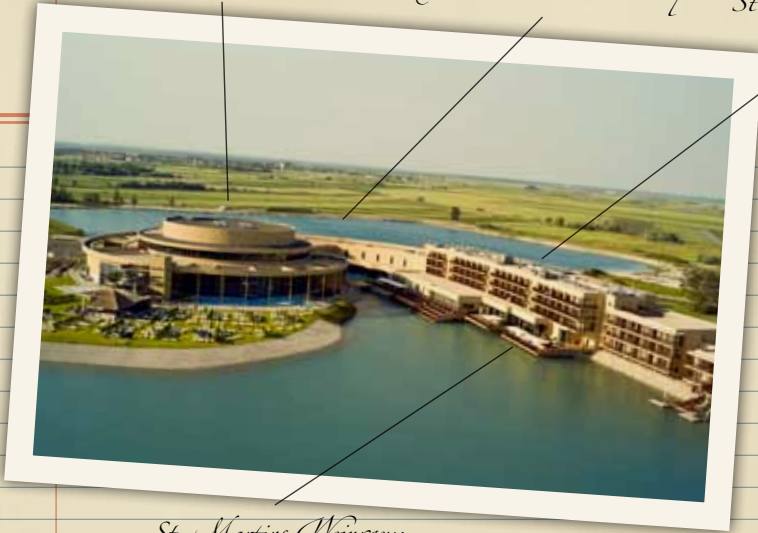
St. Martins Weinraum